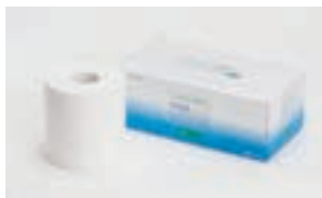
2019年3月期の贈呈商品例

毎年3月31日(当社期末)最終の株主名簿に記載または記録された1単元(100株)以上保有の株主さまといたします。