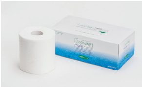
2021年3月期の贈呈商品例

毎年3月31日(当社期末)最終の株主名簿に記載または記録された1単元(100株)以上保有の株主さまといたします。